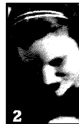
CHIARA Laureata, si occupa di marketing per un ricamificio e ha due bambini